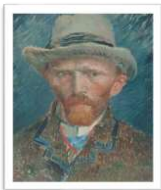
Zelfportret van Vincent van Gogh ( SLIDE 7 ).

Hierboven zie de arts van Vincent en de man met de baard is zijn buurman de postbode. De oudere dame is de eigenaresse van het café waar Vincent kwam, en het jonge meisje is de dochter van zijn arts. Deze vier portretten ( SLIDE 6 ) heeft van Gogh gemaakt omdat hij dit zelf wilde, hij kreeg hier geen geld voor omdat het geen opdracht was. Vincent van Gogh was erg arm, zijn broer kocht het materiaal voor hem want het enige wat Vincent wilde is blijven schilderen, hij is een echte kunstenaar.